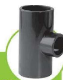
سراهی تبدیل ۹۰ درجه