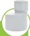
تبدیل غیر هم مرکز ECCENTRIC JOINT