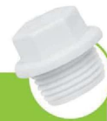
درپوش رزوه دارایه کوتاه SHORT SOCKET CAP