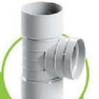
سراهی بازید ۹۰ درجه TRIPLE-COUPLING INSPECTION TEE 90-DEGREE