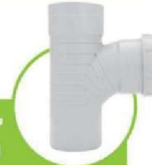
سراهی خم درجه بازید ۸۷/۵ درجه 87.5-DEGREE INSPECTION TEE