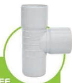
سراهی 90 درجه 90-DEGREE INSPECTION TEE