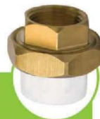
مهره ماسوره بوشن فلزی METAL COUPLING UNION