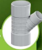
سراهی تبدیل سه سر کوپله ۴۵ درجه TRIPLE-COUPLING TEE 45-DEGREE