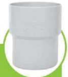
رابط نر و ماده COAXIAL CONNECTOR