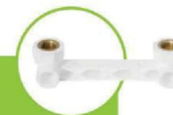
زانو بوشن فلزی زوج DOUBLE METAL COUPLING ELBOW