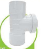
سراهی درجه بازید 90 درجه 90-DEGREE INSPECTION TEE