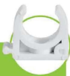
بست لوله PIPE CLAMP