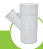
سراهی تبدیل 45 درجه سابلنت SILENT 45-DEGREE TEE CONVERSION JUNCTION