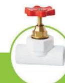
شیر فلکه کامل FULL PORT BALL VALVE