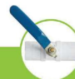
شیر مغزی برنجی BRASS BALL VALVE