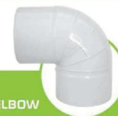
زانو 90 درجه سابلنت SILENT 90-DEGREE ELBOW