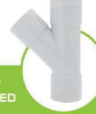
سراهی سه سر کوپله ۴۵ درجه 45 DEGREE THREE-ENDED COUPLING TEE