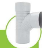
سراهی خم 87.5 درجه 87.5-DEGREE TEE