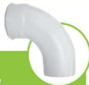
زانو خم 87.5 درجه 87.5-DEGREE ELBOW