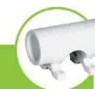
پل بست دار BRIDGE