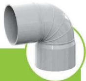
زانو دو سر کوپله ۹۰ درجه 45-DEGREE DOUBLE-COUPLING ELBOW