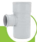
سراهی تبدیل 90 درجه سابلنت SILENT 90-DEGREE TEE CONVERSION JUNCTION