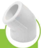
زانو ۴۵ درجه 45-DEGREE ELBOW