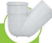
سیفون پایه دار سايلنت SILENT STANDPIPE TRAP