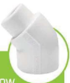
زانو چپقی ۴۵ درجه 45-DEGREE SOCKET ELBOW