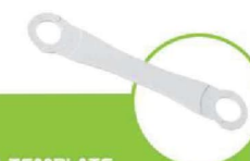
شابلون نصب INSTALLATION TEMPLATE