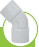
زانو دو سر کوپله ۴۵ درجه 45-DEGREE DOUBLE-COUPLING ELBOW