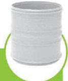
کوپلینگ بدون ترمز NON-BRAKE COUPLING