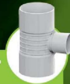
سراهی تبدیل سه سر کوپله ۹۰ درجه TRIPLE-COUPLING TEE 90-DEGREE