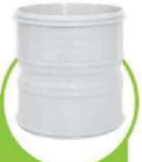
کوپلینگ ترمز دار BRAKE COUPLING