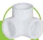
سراهی سه گنج CORNER TEE