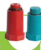
درپوش پایه بلند قرمز و آبی LONG CAP - RED & BLUE