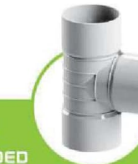
سراهی سه سر کوپله ۹۰ درجه 90 DEGREE THREE-ENDED COUPLING TEE