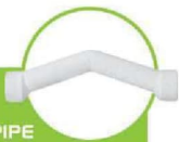
لوله خم‌دار دو سر بوشن DOUBLE SOCKET BEND PIPE