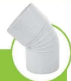
زانو 45 درجه سابلنت SILENT 45-DEGREE TEE