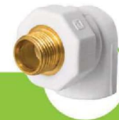
زانو یکسر مغزی فلزی ONE-END METAL CORE ELBOW