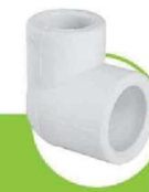
زانو تبدیل ۹۰ درجه 90-DEGREE REDUCING ELBOW