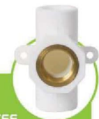
سراهی بوشن فلزی دیواری METAL COUPLING WALL TEE