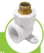
زانو مغزی فلزی دیواری WALL CORE METAL ELBOW