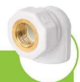
زانو یکسر بوشن فلزی ONE-END METAL COUPLING ELBOW