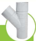
سراهی 45 درجه سابلنت TRIPLE-COUPLING TEE 45-DEGREE